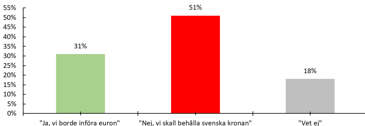
Diagram 2: I mars 2023 genomförde Novus samma undersökning. Vi har också valt att titta på SCB:s undersökningar i november och maj som referens.

Diagram 1: "Tycker du att Sverige borde införa euron som valuta eller tycker du att vi ska behålla svenska kronan?". Undersökningen genomfördes mellan 15–20 sep i Novus Sverigepanel. Totalt svarade 1 054 personer på undersökningen.